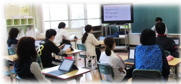
先生たちも皆で研修(学びあい)