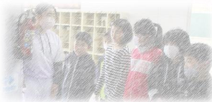
「ここからはケンケンをします」 高学年の説明を真剣に聞きます。