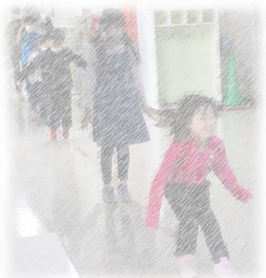
ここはジャンプゾーン。 遠くに跳べるかな？