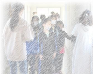
みんなの様子を見ながら進めるリーダーさん。

体力づくりの取組がスタートしました。全校児童が3色に分かれ、縦割りで行います。週2回中休みに、「外でマラソンコース」と「校内でサーキットコース」に分かれて基礎体力を養います。高学年がリーダーとして進行や、やり方の説明を行っています。鬼志別小学校は、体を動かすことが好きな子が多いので、楽しみながら体力作りを行っています。体力がある子は、根気強く物事に取り組むことができたり、学習に向かう力につながったりしています。心の成長のためにも体力づくりを大切に取組んでいきます。